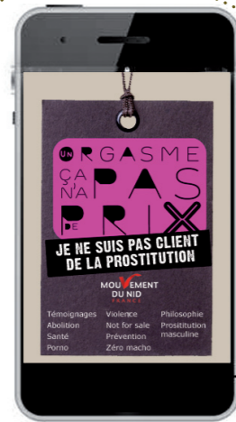
Site adapté pour SmartPhones

Permet d'expliquer la démarche du Mouvement du nid en utilisant les références générationnelles des jeunes adultes > amener le public concerné sur une page web spécifique à l'opération (+ renvoi site du mouvement de NID) Donc au dialogue.