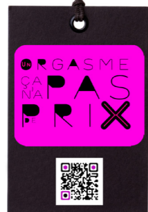
Etiquette (vêtements ou autres)

Objet facile à décliner pour toutes sortes de partenariats